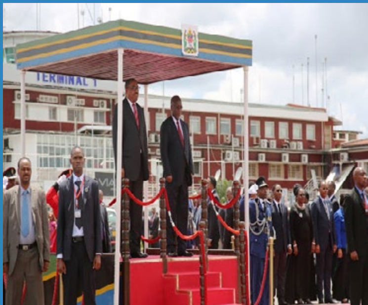
Waziri Mkuu wa Shirikisho la Jamhuri ya Kidemokrasia ya Ethiopia, Hailemariam Dessalegn (kushoto) Rais wa Jamhuri ya Muungano wa Tanzania Dkt. John Pombe Magufuli wakipata salamu ya heshima toka kwa kikosi cha Jeshi la Wananchi Baada ya kuwasili nchini hivi karibuni