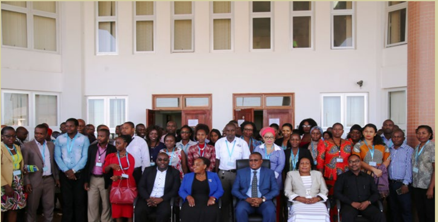
Aliyekuwa Waziri wa Habari, Utamaduni, Sanaa na Michezo Mhe. Nape Nnauye akiwa katika picha ya pamoja na Maafisa Mawasiliano wa Serikali wakati wa Kikao kazi cha 12 cha Maafisa Mawasiliano wa Serikali kinachofanyika Mkoani Dodoma.

Alisema ili taarifa za utekelezaji wa mafanikio ya Serikali ziweze kuwafikia wananchi, ni wajibu wa Maafisa Habari na Mawasiliano kujenga na kuimarisha mtandao wa mawasiliano baina yao pamojanawatendajiwengine katika maeneo yao ya kazi.