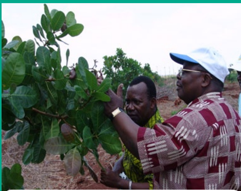
Rais wa Awamu ya Tatu, Benjamin William Mkapa akiangalia mti wa Korosho katika moja ya shamba Wilayani Masasi Mkoani Mtwara.