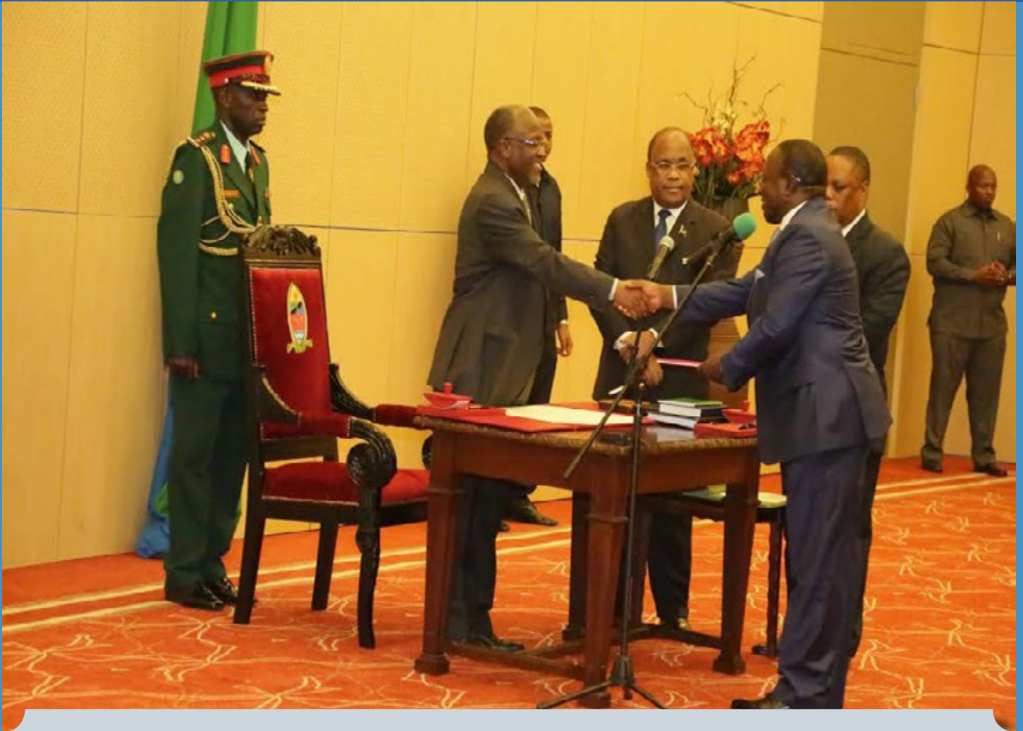
Rais wa Jamhuri ya Muungano wa Tanzania Dkt John Pombe Magufuli akimkabidhi nyenzo za kazi Dkt. Harrison Mwakyembe baada ya kumuapisha kuwa Waziri wa Habari, Utamaduni Sanaa na Michezo Ikulu jijini Dar es salaam Machi 24, 2017

Dkt. Mwakyembe amewaomba wadau wa michezo na watanzania kwa ujumla kuendelea kuipa nguvu na kuisaidia kwa hali na mali Timu ya Taifa ya Mpira wa Miguu ya Vijana chini ya umri wa miaka 17 inayoshiriki katika fainali za mataifa ya Afrika kwa vijana (AFCON) nchini Gabon.