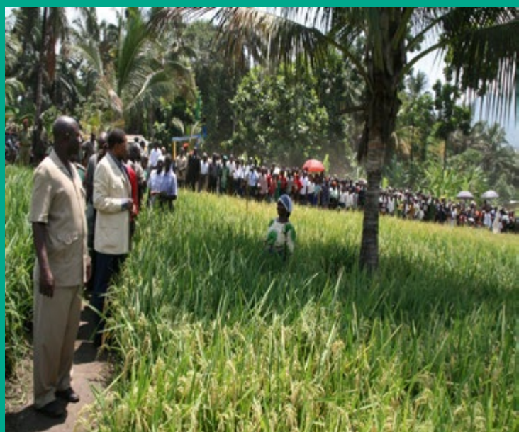
Rais wa Awamu ya Nne, Dkt. Jakaya Mrisho Kikwete akiangalia shamba la mpunga Wilayani Kilosa Mkoani Morogoro.