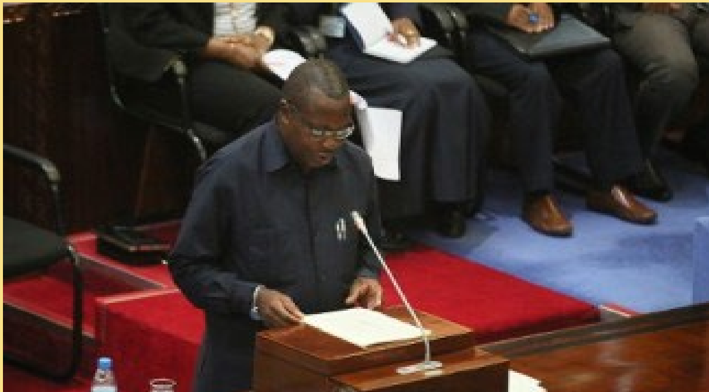
Waziri wa Fedha na Mipango, Mhe. Dkt. Philip Mpango akiwasilisha Mapendekezo ya Mpango wa Maendeleo wa Taifa na Kiwango cha Ukomo wa Bajeti kwa mwaka wa Fedha, 2017/18 ambapo imepanga kutumia Sh. Trilioni 31.6.

Zone) na tayari maandalizi ya kuweka miundombinu, hususan barabara, kwa eneo hilo yanaendelea.