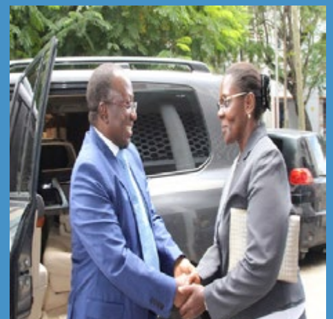
Waziri wa Habari Utamaduni Sanaa na Michezo Mhe. Dkt Harrison George Mwakyembe akisalimiana na Naibu wake Mhe. Anastazia Wambura wakati alipowasili katika ofisi za Idara ya Habari (MAELEZO)

Waziri wa Habari Utamaduni Sanaa na Michezo Mhe. Dkt. Harrison George Mwakyembe amechukua nafasi ya Mhe. Nape Moses Nnauye aliyekuwa Waziri wa Wizara hiyo mara baada ya Rais Magufuli kufanya mabadiliko madogo ya Baraza lake la mawaziri hivi karibuni.