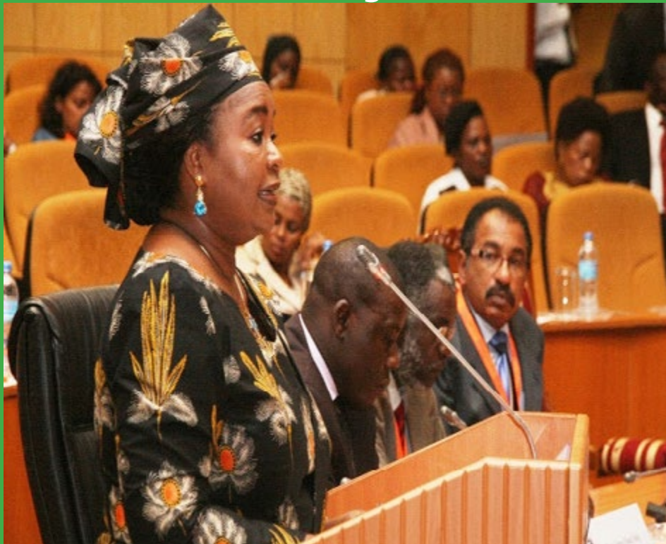
Balozi wa Kiswahili Barani Afrika, Mama Salma Kikwete