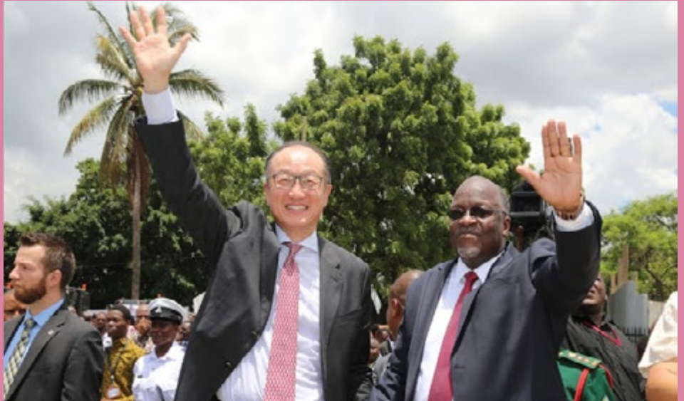
Rais wa Jamhuri ya Muungano wa Tanzania Dkt. Jophn Pombe Magufuli na Rais wa Benki ya Dunia Dkt. Jim Yong Kim wakiwaaga wananchi waliohudhuria hafla ya uwekaji wa jiwe la Msingi katika mradi wa ujenzi wa Barabara za Juu katika makutano ya Ubungo jijini Dar es Salaam.