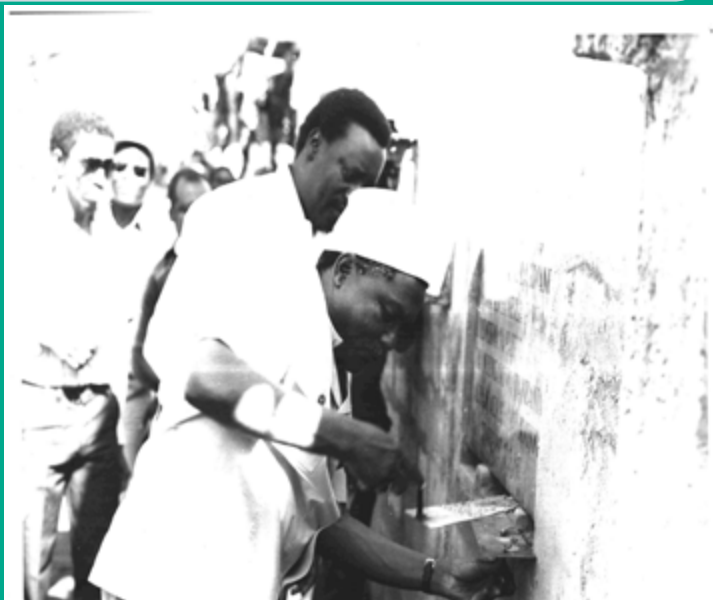
Rais wa Awamu ya Pili, Ali Hassan Mwinyi akiweka jiwe la msingi katika kiwanda cha kuchambua pamba cha Kakonko Wilayani Kibondo Mwaka 1980.