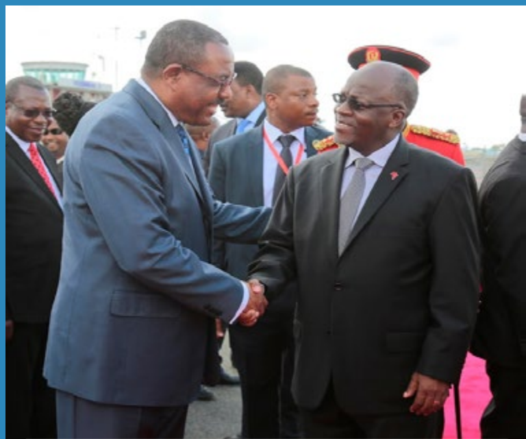
Rais wa Jamhuri ya Muungano wa Tanzania, Dkt. John Pombe Magufuli akiagana na mgeni wake Waziri Mkuu wa Ethiopia, Hailemariam Dessalegn kabla ya kupanda ndege na kuondoka jijini Dar es Salaam.