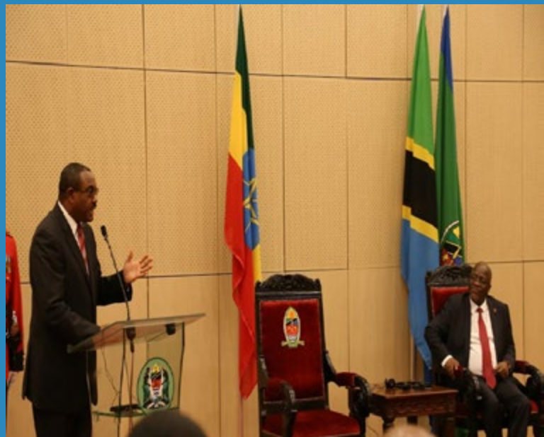
Waziri Mkuu wa Ethiopia Mhe. Hailemariam Dessalegn akiongea na waandishi wa habari katika hafla ya utiliaji saina mikataba ya ushirikiano baina ya Tanzania na Ethiopia, Kulia ni Rais wa Jamhuri ya Muungano wa Tanzania Dkt. John Pombe Magufuli ikulu Jijini Dar es Salaam